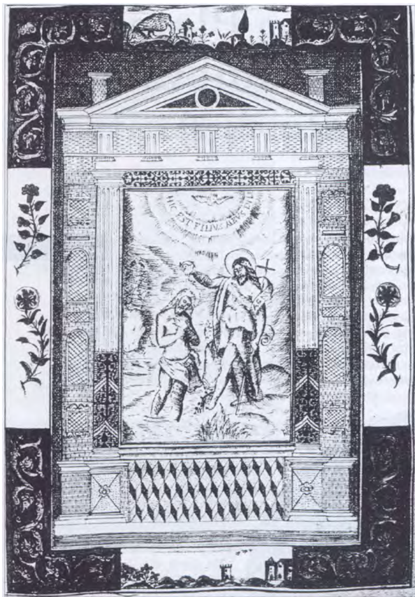
In alto: Fig. 2 - La miniatura di S. Giovanni Battista contenuta nel "Liber Rebus" f.21r. che avrebbe ispirato il Platania.

pe fu viceré di Valenza dal 1720 al 1737, cioè D. Luigi, presso noi, secondo di questo nome e figlio di Stefano II: avendo lui ivi pieni poteri, asportò molte cose da quella città, donandoli a questi suoi stati, e ne è tuttora piena Acicatena, dove ordinariamente risiedeva, e specialmente le chiese, come tutti ivi dicono».